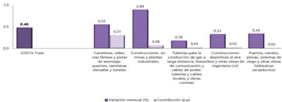
Gráfico 20. Variación mensual y contribución del ICOCIV según tipos de construcción Total nacional Abril 2023 Pr

Nota: La diferencia de la suma de las variables, obedece al sistema de aproximación en el nivel de los dígitos trabajados en el índice.